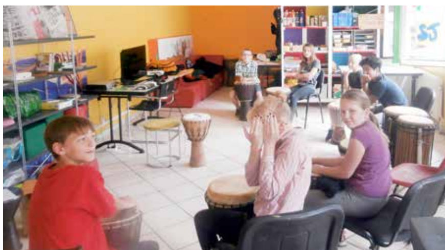
Une répétition "percussions" au secteur jeunes

curité routière, et pour susciter peut-être des vocations professionnelles, je vais lui proposer d'organiser et d'animer une visite du centre de rééducation de Salins. »