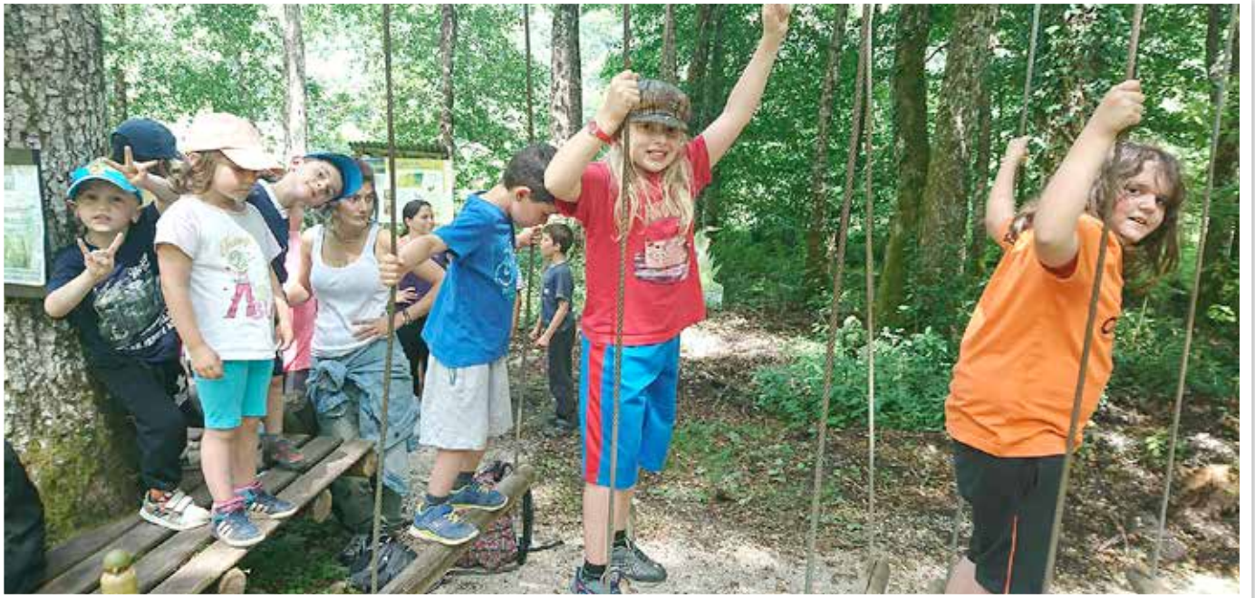
Le Centre de Loisirs de Salins accueille et anime les enfants de 7h30 à 18h30 du lundi au vendredi.

Les nouvelles activités périscolaires se pratiquent les mardis, jeudis et vendredis de 15h30 à 16h30. Sur 252 élèves scolarisés à Salins, 180 y sont inscrits. Ces activités sont gérées par le Centre de Loisirs, dont les 14 animateurs se déplacent dans les écoles Voltaire, Chantemerle et Saint-Anatoile qui mettent des salles à leur disposition. Des animateurs extérieurs interviennent pour les activités impliquant une certaine spécialisation telles que la musique, l'escalade, le tir à l'arc ou la boxe française.