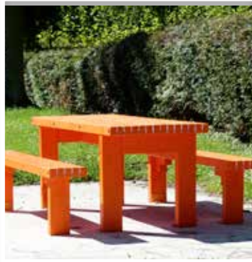
Les arbres abattus du parc sont recyclés en sièges et tables par les services techniques municipaux