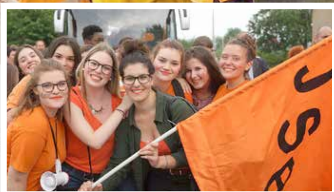
Avec le retour de leur club au niveau national, les fans ont le sourire.